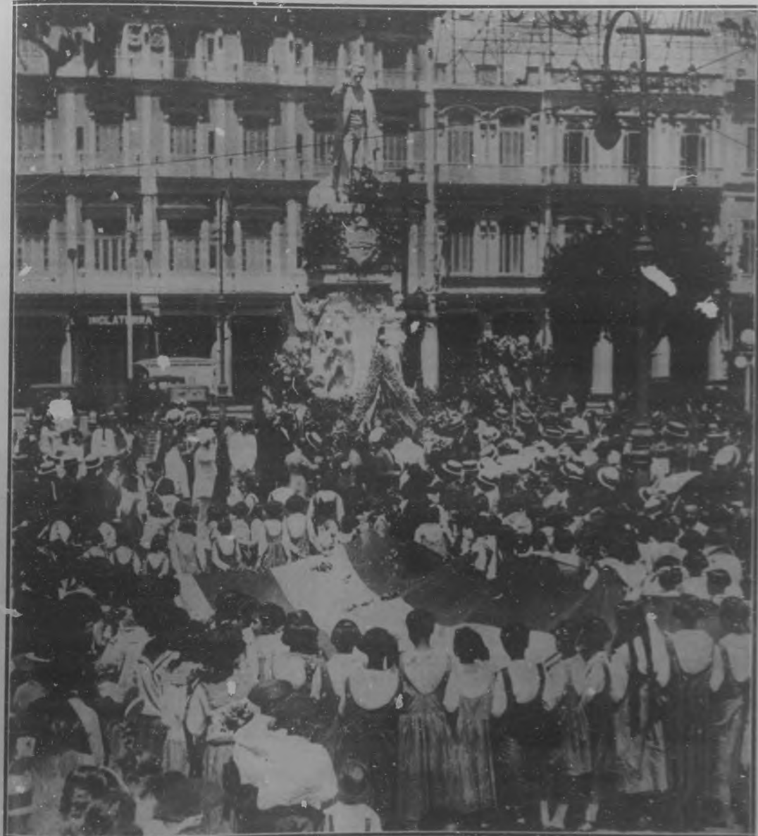
Entre las diversas festividades organizadas en esta ciudad para conmemorar dignamente el 24º aniversario del advenimiento de la República, una de las más sobresalientes fué la peregrinación a la estatua de Martí. El grabado que publicamos, reproduce el momento en que las alumnas de la escuela número 27 llegaban frente a la estatua del Maestro llevando una inmensa bandera cubana y numerosos ramos de flores.