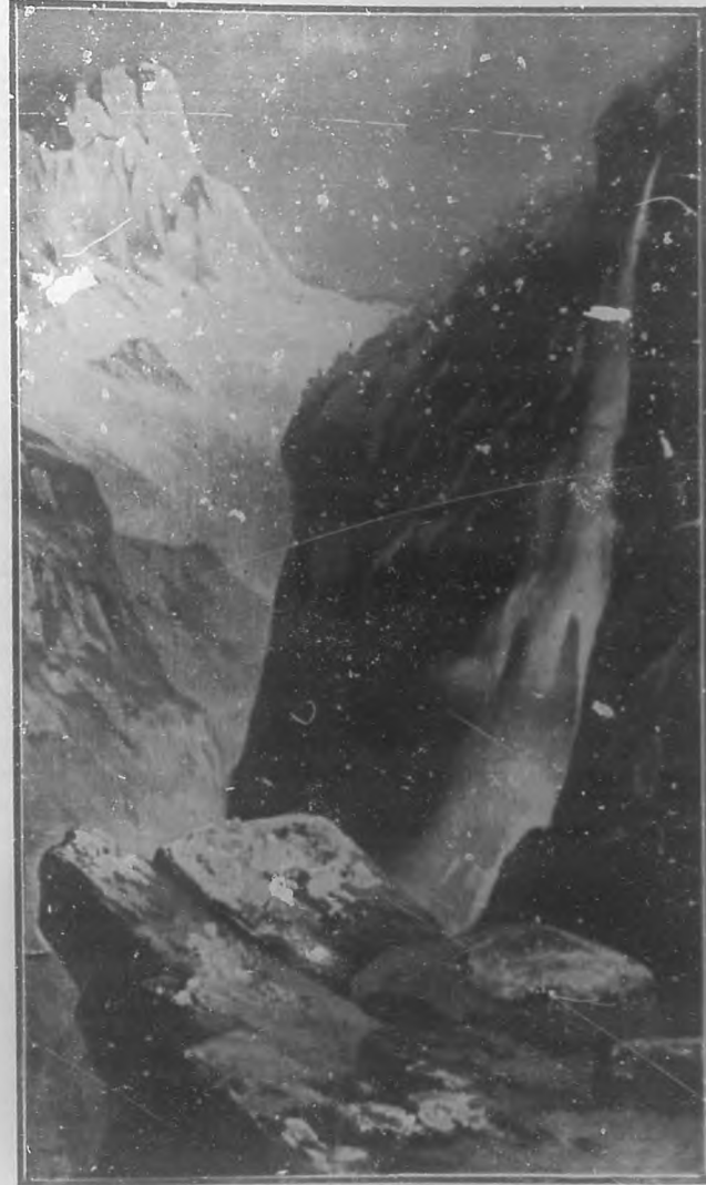
DONDE LAS AGUILAN ANIDAN