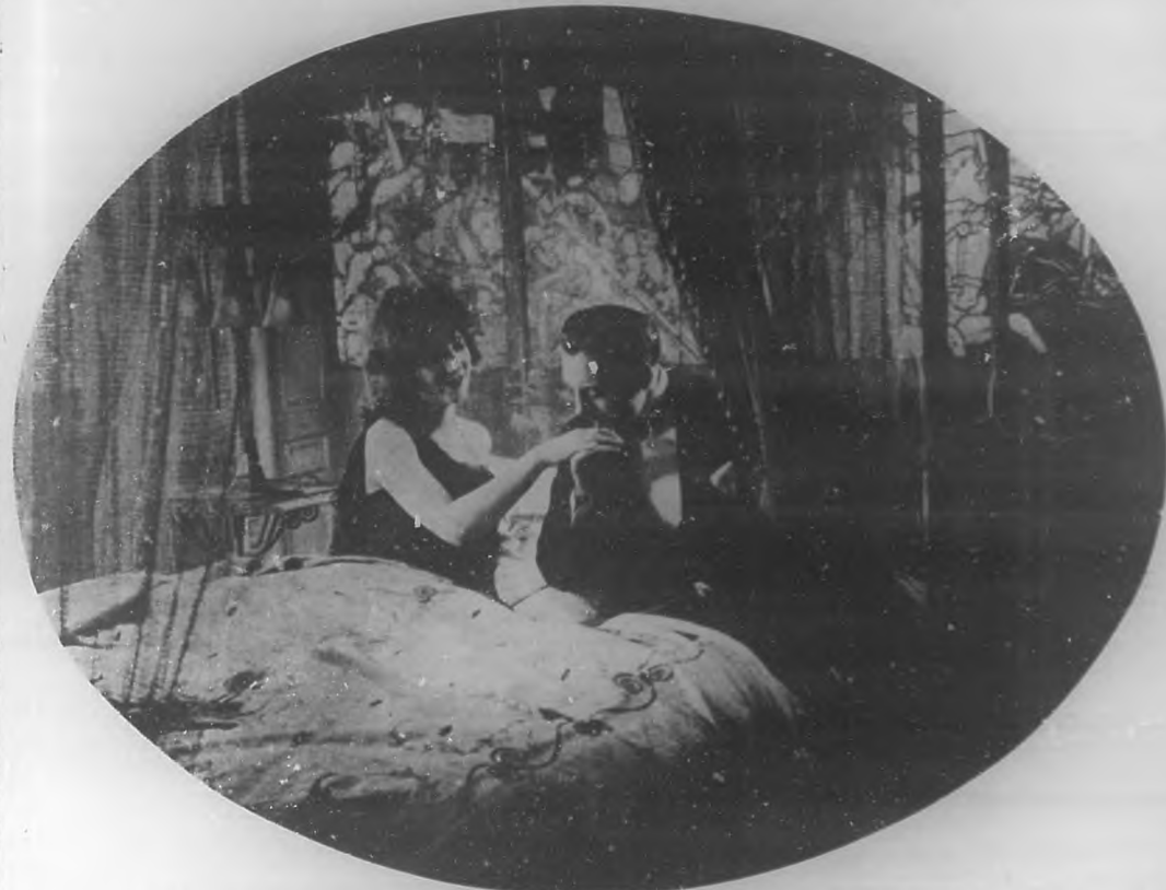
Interesante y sugestiva escena de la graciosa película "¡Socorro, socorro!", de la que es principal intérprete el famoso Max Linder y que será estrenada próximamente en "Capitolio".