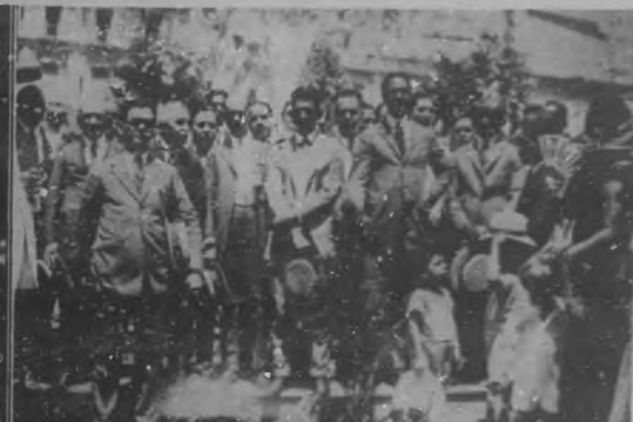
HONRANDO LA MEMORIA DEL APOSTOL. —Algunas de las personalidades que fueron en peregrinación ante la estatua de Martí con motivo del 24° aniversario de su gloriosa muerte.

rias localidades concurren a su sepeño, imponente manifestación de duelo que tuvo efecto el día 15.