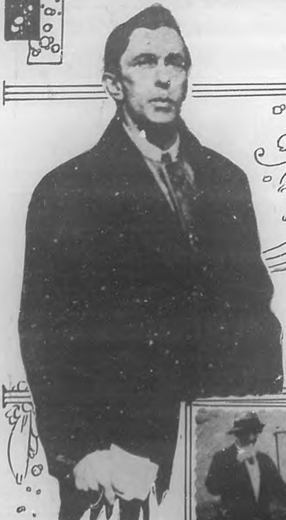
RORY O'CONNOR El caudillo de los re- beldes Irlandeses.