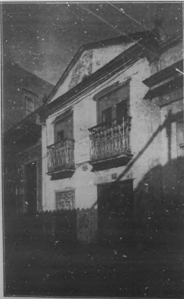
La casa donde nació Martí.