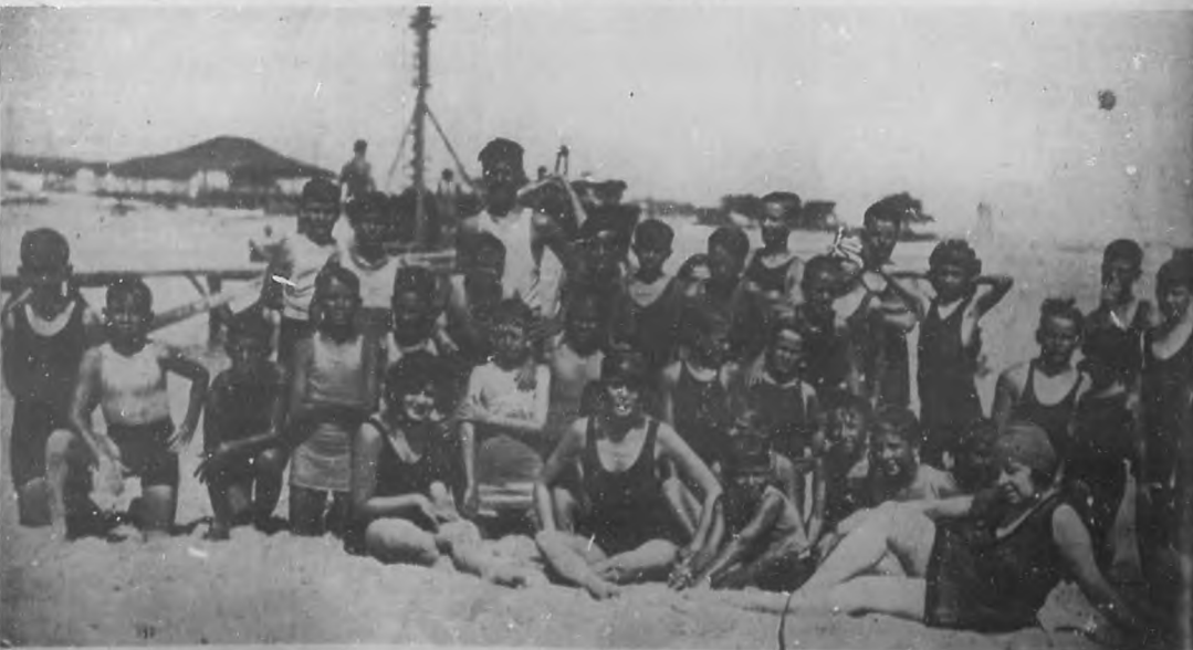
EL BALNEARIO "LA CONCHA" —Simpático grupo de asiduos concurrentes al balneario "La Concha" en la playa de Marianao.