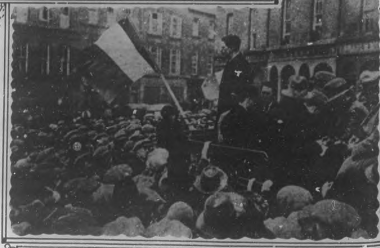
Valera el batallador ex- Presidente de la República de Irlanda pronunciando un discurso en una plaza de Ennisceothly

grandes para que intentaran emanciparse, bastando conque una sola diese voz de independencia para que todas la imitasen.